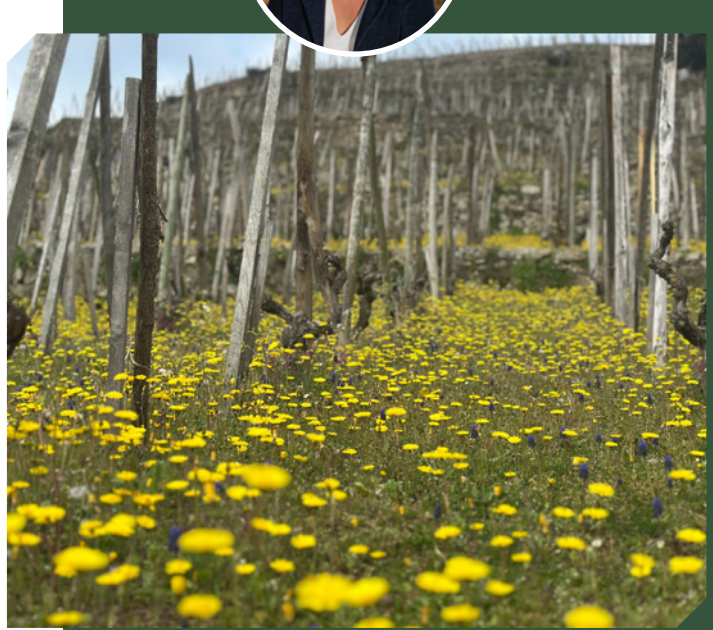
Le printemps est là, au Domaine de Corps de Loup (lire plus bas)